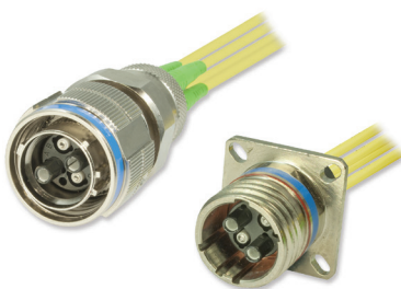
MIL-38999 DM4 size 13