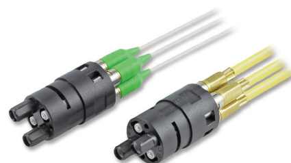
DM4 OEM Insert