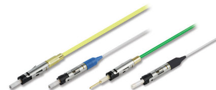
DM Termini (Contacts optiques et électriques)